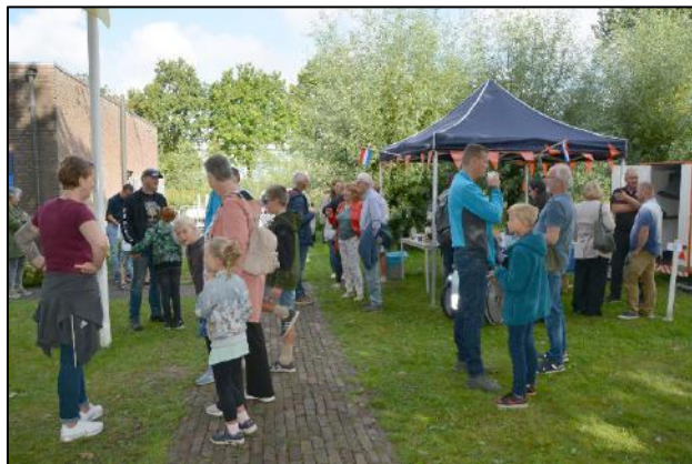
Door het mooie weer was het ook buiten heel druk