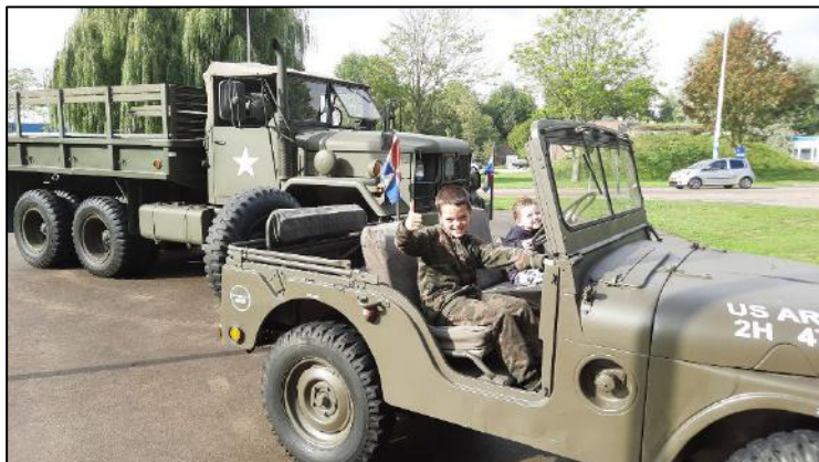
De jeugd was vooral onder de indruk van het legermaterieel