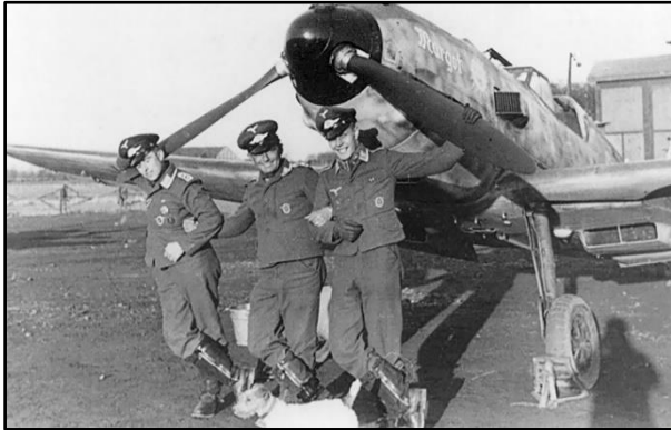
Vrolijke Duitsers en hond op Flugplatz Katwijk

Heb je foto's die tijdens of kort na de Tweede Wereldoorlog op het voormalige vliegveld Valkenburg zijn gemaakt? Dan kun je ons helpen! We zijn druk bezig met het organiseren van een thema-expositie over 'Flugplatz Katwijk'. Zo noemden de Duitse bezetters het vliegveld in de oorlog. De expositie over het vliegveld in oorlogstijd moet in 2025 het hele jaar te zien zijn in het Bezoekerscentrum.