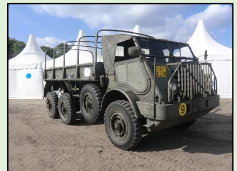
DAF YA-328

Het bezoekerscentrum is open op zaterdag van 10 tot 16 uur . Volg voor het laatste nieuws de berichten op onze website, vliegveldvalkenburg.nl en kijk voor andere verdedigingswerken op forten.nl .