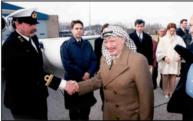
Yasser Arafat met Jetstar op het hoofdplatform

Nederland speelt in 1997 en 1998 een bemiddelende rol in het Palestijns-Israëlische conflict. Met het eerder genoemde Algerijnse toestel bezoekt Arafat Valkenburg op 2 februari 1997 en met een Spaanse Falcon 900 (T.18-1) op 5 februari 1998. Op uitnodiging van de Economische Faculteitsvereniging Rotterdam openen Arafat en premier Kok de business week op 30 maart 1998. De volgende dag vertrekt Arafat vanaf Valkenburg in het Algerijnse toestel.