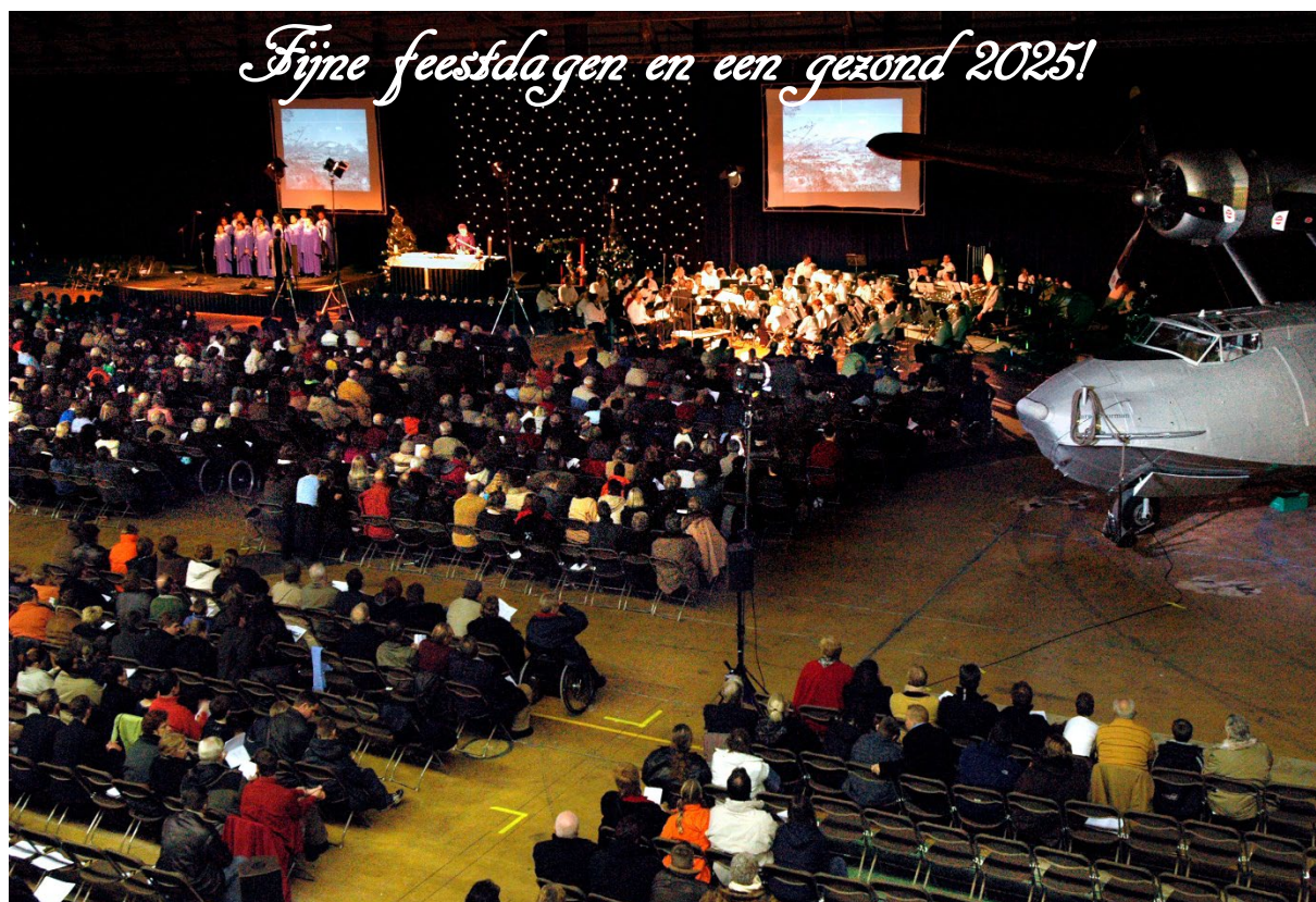
Een jaarlijkse traditie op het vliegveld, de kerstnachtviering. De foto is uit 2004.