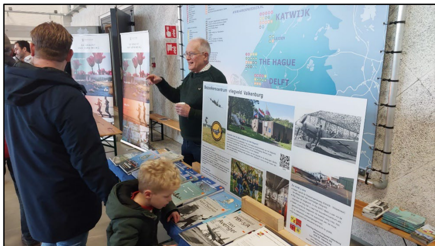
Wij stonden ook op de informatiemarkt

In Hangaar 1, dat dienst doet als dronetestcentrum, kon je kijken naar demonstraties met verschillende soorten drones en zelf aan de knoppen zitten en een vlucht maken. De kleine trainingsdrones vlogen je af en toe om de oren, maar