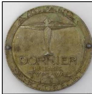
De D6 na de crash en het bewaard gebleven plaatje.