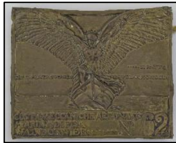
De D3 op Morokrembangan en het plaatje.